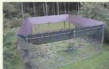
【サル大量捕獲囲いワナ】

そして、他地区で1年9ヶ月の間に61匹のサルを捕獲したという実績を誇る『サル大量捕獲囲いワナ』（写真参照）2基（350万円）の設置も決まりました。これには私も大きな期待をしております。本市の有害鳥獣対策は大きな一歩を踏み出しました。